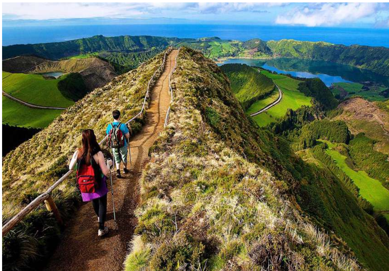
SENTIER MENANT AU POINT DE VUE DIT « BOCA DO INFERNO » (REGION DE SETE CIDADES)

Azores Atout Cœur est une marque de l'agence Azores Trips 4 You, Unipessoal LDA Rua da Misericórdia, n°28 - 9600-092 Rabo de Peixe Portugal - NIF : 517499649 Licença de turismo RNAVT : 11751 RCP - Allianz : n°207175887 Tél. : 00.33.(0)6.07.16.14.68 Mail : georges@azores-atoutcoeur.com