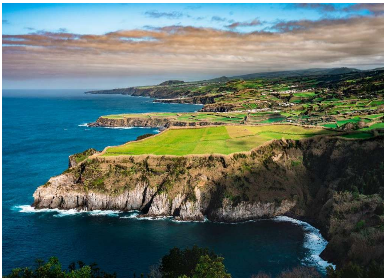
POINT DE VUE DU MIRADOURO DE SANTA IRIA (REGION NORD DE L'ILE DE SAO MIGUEL)

Azores Atout Cœur est une marque de l'agence Azores Trips 4 You, Unipessoal LDA Rua da Misericórdia, n°28 - 9600-092 Rabo de Peixe Portugal - NIF : 517499649 Licença de turismo RNAVT : 11751 RCP - Allianz : n°207175887 Tél. : 00.33.(0)6.07.16.14.68 Mail : georges@azores-atoutcoeur.com