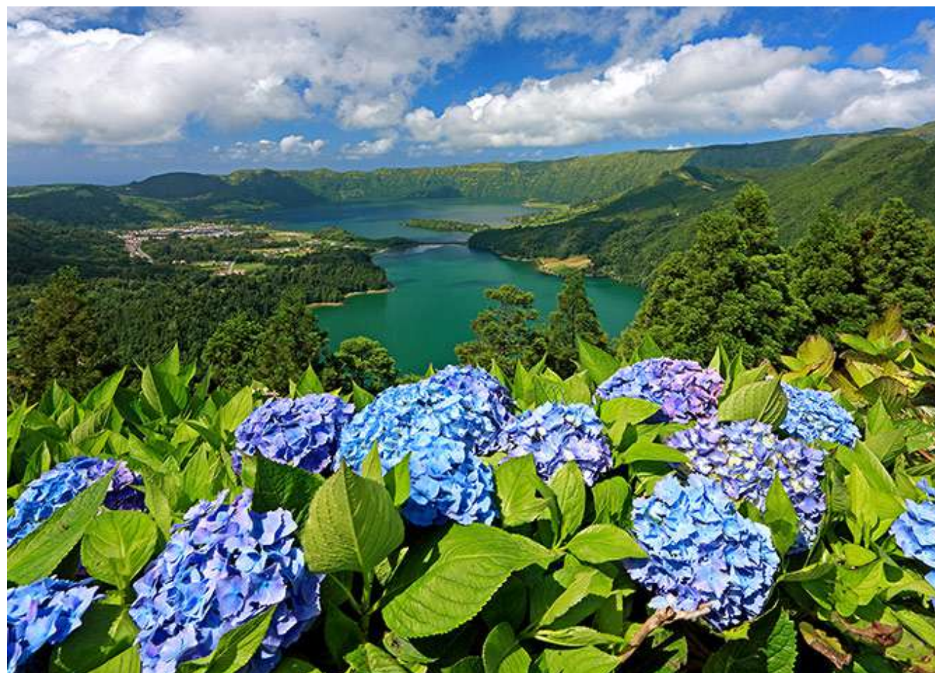
PANORAMA SUR « LE LAGOA AZUL ET LE LAGOA VERDE » (REGION DE SETE CIDADES)

Offre spéciale du 22 au 29 mars 2025 séjour avec guide local pour une découverte de l'île de São Miguel